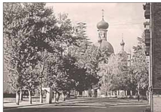
☉ Угол Самокатной улицы и Слободского переулка

Меня интересовала история нашего района, и дома особенно.