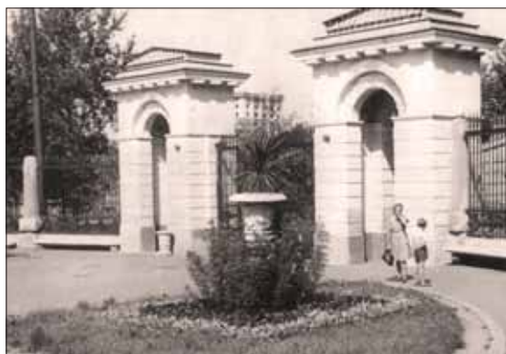
☉ Вход в Лефортовский парк

зование площади коридора для сундуков и ящиков, в которых хранили картофель и овощи на зиму... Все это вынуждало соседей договариваться и считаться друг с другом, говоря современным языком, быть толерантными. Мы, дети, были частичкой этого коммунального сообщества. В семейном альбоме много фотографий, относящихся к 1951–1953 годам: праздники «в складчину» за общим столом с соседями. Пожалуй, таких веселых и многолюдных праздников и встреч Нового года больше никогда не было.